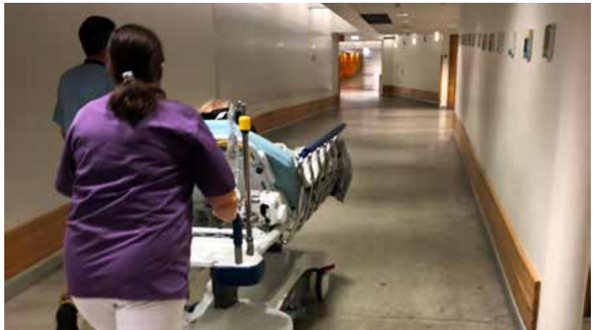
Afar mikilvægt er að breytingar sem þessar séu gerðar á forsendum og út frá sjónarhóli starfsfólksins en ekki atvinnurekenda.

Að mati BSRB mun hækkan hámarksaldurs heilbrigðisstarfsmanna ríkisins ekki leysa þann vanda sem breytingunum er ætlað að gera. Samkvæmt þeim upplýsingum sem bandalagið hefur þá hefur ekki farið nein könnun fram meðal þeirra heilbrigðisstarfsmanna sem nú nálgast starfslokaaldur á því hvort þau hafi hug á að starfa lengur en til 70 ára aldurs. Þau störf sem um ræðir eru mörg hver slítandi störf þar sem mikið mæðir á starfsfólkinu alla daga og undanfarin ár hafa verið gífurlega erfið fyrir þennan sama hóp. Það er því vandsæð að hér sé um einhvers konar töfralausn að ræða. Það þarf að huga vel að þeim atriðum