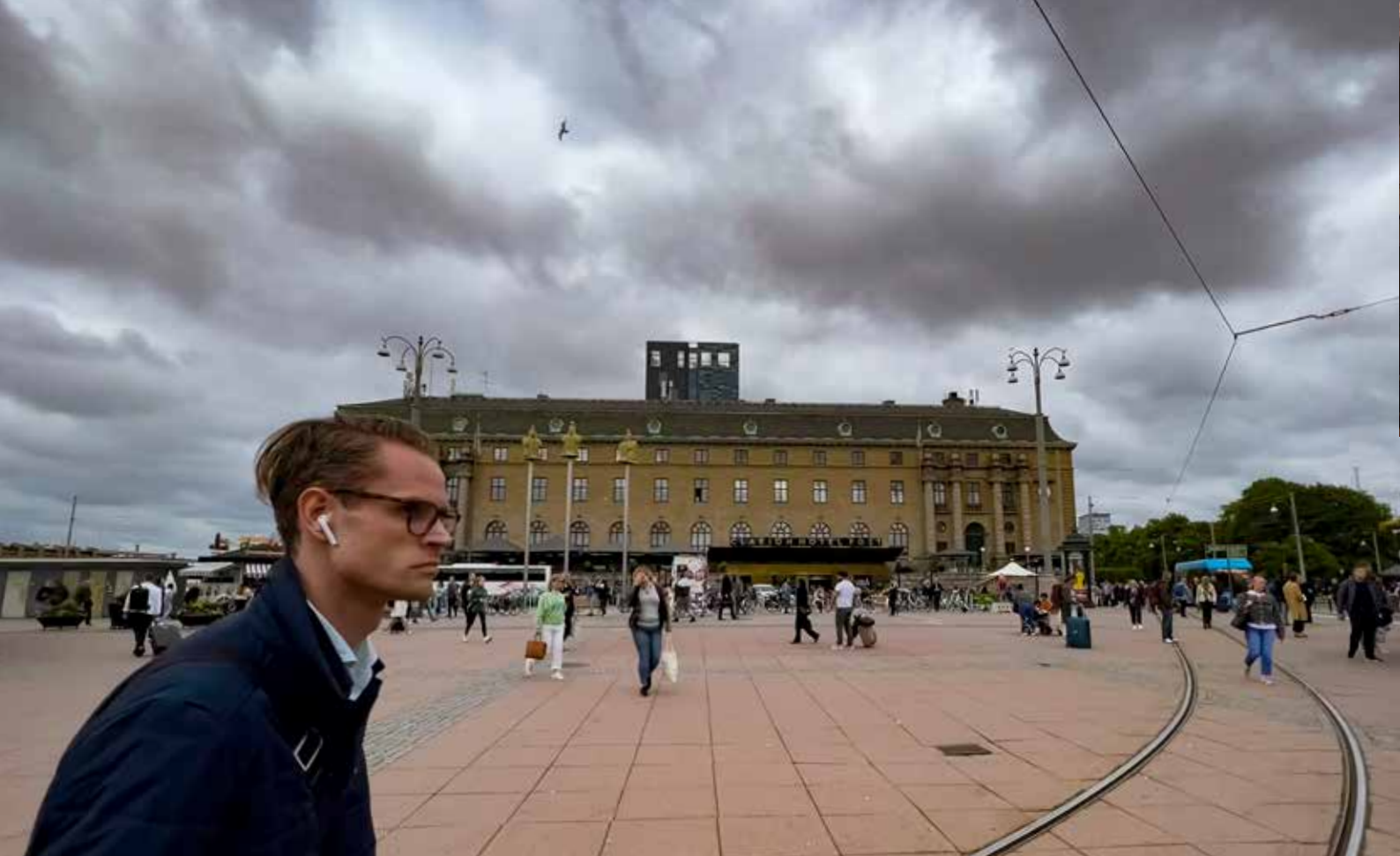
Drottningartorg þar sem NTR-ráðstefnan var haldin í Gautaborg.