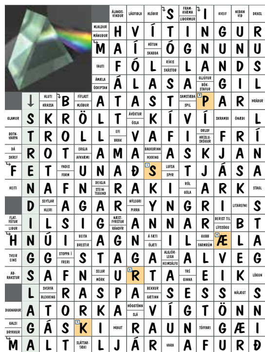
Lausnarorðið er Spræk