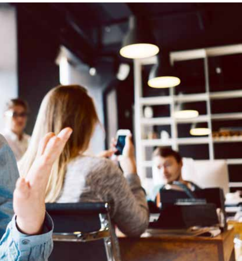
tengist starfsskipulagi, stjórnun og samskiptum.

Flestir einstaklingar sem glíma við kulnun lýsa álagi tengdu bæði vinnustað og heimilisaðstæðum sem vefst saman við aðra þætti eins og t.d. persónuleika og fyrri lífsreynslu. Það er ekki alltaf hægt að aðskilja mismunandi þætti í lífi fólks og sjaldan hægt að einblína á einn þátt sem orsök kulnunar. Algengara er að konur lenda í kulnun en rannsóknir hafa ekki getað sýnt fram á að þetta