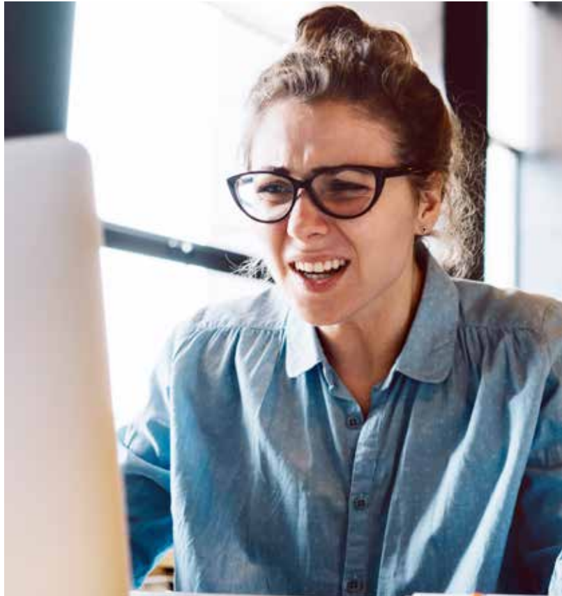
Frekar ætti að huga að því að koma í veg fyrir meginvandann, nefnilega sjálft álagið sem

Flestir einstaklingar sem upplifa mikla streitu þurfa ekki að leita hjálpar hjá fagaðilum. Vægari streitutengd einkenni svo sem magatruflanir, svefntruflanir, pirringur, höfuðverkur og áhyggjur eru merki um að huga þurfi að álagspunktum og að nægjanleg hvíld sé tryggð. Þegar um klíníska kulnun er að ræða eru þreytu-