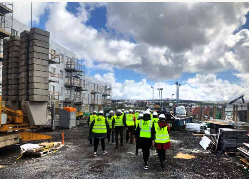
Verkalýðsforystan skoðar uppbyggingu Bjargs íbúðafélags í Vogunum í Reykjavík á síðasta ári.

var stofnað. Blær er næsta þrep fyrir ofan Bjarg þegar kemur að hagnaðarsjónarmiðum á leigumarkaði: Á meðan Bjarg er rekið án hagnaðarsjónarmiða er ætlunin með Blæ að reka það sem lághagnaðarfélag.