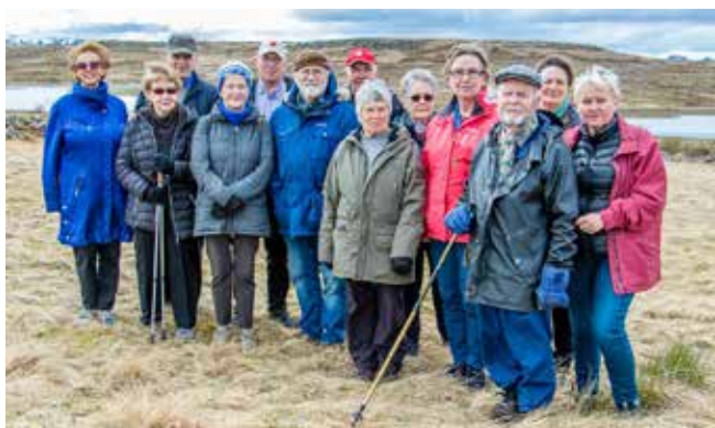
Allir eru velkomnir í göngur með Grjóthörðum göngugörpum. Gengið verður saman, alveg sama hvernig viðrar – eða næstum því.

Lífeyrisdeild Sameykis vill minna þau sem eru að fara á lífeyri á að skrá sig í Lífeyrisdeild Sameykis til að fá fréttabréfið, aðgang að símenntunarstyrkjum og skemmtilegum viðburðum. Hægt er gera það á vefsíðu Sameykis – sameyki.is. ■