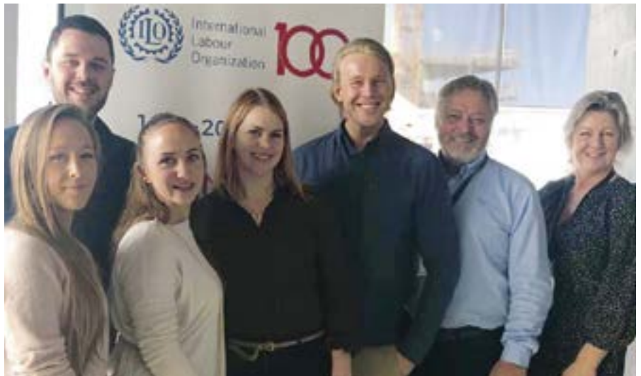
Fulltrúar frá Ung-Parat

Sameyki tekur þátt í fjölbreyttu starfi jafnt á norrænum og alþjóðlegum vettvangi. Samstarf við systerfélög okkar á norðurlöndunum er þar fyrirferðamest, enda eigum við sameiginleg með þeim fjölmörg málefni. Að deila reynslu og eiga samstarf um verkefni dagsins í dag og framtíðarinnar er afar mikilvægt í starfsemi sem okkar. Það er okkar gróði að hlusta á reynslu stærri þjóða en um leið er rödd okkar einnig mikilvæg. Íslenskur vinnumarkaður hefur sérstöðu og við þurfum að deila reynslu okkar með öðrum. Mörg málefni eru leyst með rafrænum samskiptum á milli landa en fulltrúar Sameykis sitja einnig fundi og ráðstefnur erlendis og fá hingað heim góða gesti. Í síðasta mánuði komu til fundar framkvæmdstjórar fulltrúar NTR sem eru samtök norrænna stéttarfélaganna sem eiga það sameiginlegt að semja við sveitarfélögin og funduðu hér á skrifstofunni. Efni fundarinnar var m.a. skipulagning spennandi ráðstefnu sem haldin verður árið 2020 og við munum eflaust fá að fylgjast með. Þá komu einnig ungliðar frá norska stéttarfélaginu Parat sem komnir voru hingað til lands til að kynna sér málefni vinnumarkaðarinnar, jafnréttismál og fleira.